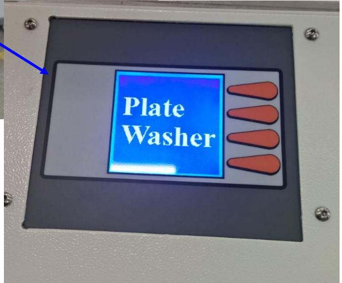
Pannello di controllo