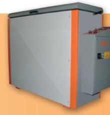
MANUAL AND AUTOMATIC OVENS