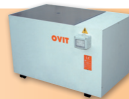
UNIVERSAL WATER RECYCLERS