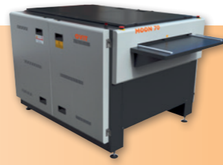
WATERLESS PLATE WASHER