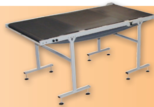
LGF INLET MOTORIZED CONVEYOR