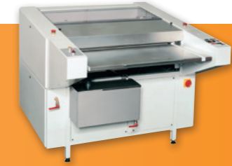
OFFSET PLATE CLEANER