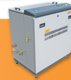
REVERSE OSMOSIS SYSTEMS