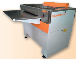
FLEXO PLATE CLEANER