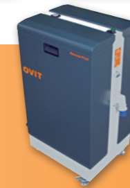
FOUNTAIN SOLUTION RECYCLER