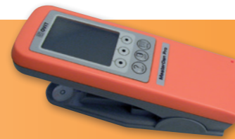
COLOR REFLECTION DENSITOMETER