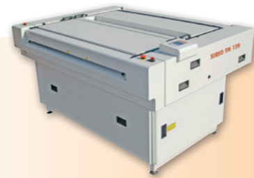
THERMAL CTP PLATE PROCESSORS