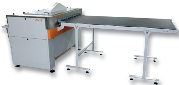
OPTIONAL: LGF INLET MOTORIZED CONVEYOR AND ST SLOPING OUTLET TABLE

Sehr stabil und umweltfreundlich • Gefertigt aus Edelstahl • Entworfen für einfache und schnelle Wartung • Reinigung aller Druckfarben über rotierende und changierende Bürsten: zwei oder drei Abhängigkeit von den Formen • Erhebliche Zeitersparnis in Übereinstimmung mit den Sicherheitsvorschriften für Personal und Umwelt durch Automatisierung des Reinigungsprozesses der Flexo-Druckplatten • Heiz- und Filtersystem für den Reiniger für zusätzliche Reinigungswirkung sowie erhöhte Chemiestandzeit • Geschlossener Kreislauf zur Filtrierung des Spülwassers für weniger Verschmutzung und Wassereinsparung • Alle Parameter sind über ein digitales Kontrollpanel verstellbar • Einlaufstisch und Auslauf-Aufnahmekorb • Optional: motorisierte Einlauf-Fördervorrichtung LGF sowie schräger Auslaufstisch ST • Auch als "S" Version für den Einsatz mit einem Lösungsmittel