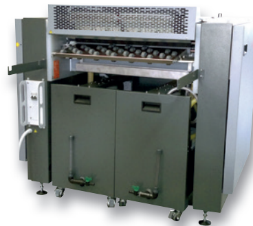
RECYCLERS ON WHEELS